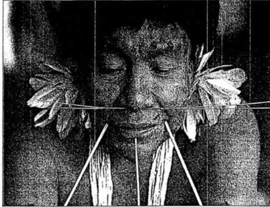
Al estudiar a personas en diferentes culturas, los psicólogos están aprendiendo cómo la sociedad moldea la personalidad al alentar o desanimar comportamientos específicos.

Una esfera social importante tiene que ver con las relaciones entre hombres y mujeres. En el nivel de las diferencias entre los sexos, la personalidad puede operar en forma diferente para los hombres que para las mujeres. El género es una parte esencial de nuestras identidades.