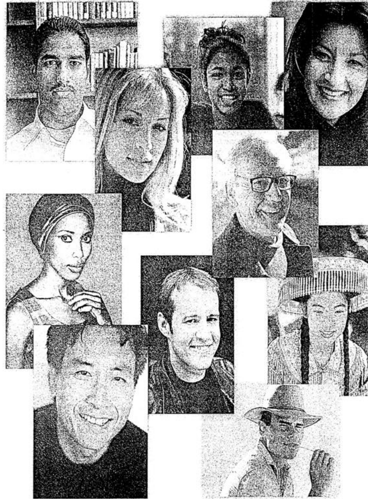
Las personas son diferentes entre sí en muchas formas. La ciencia de la psicología de la personalidad proporciona una comprensión de las formas psicológicas en que las personas difieren entre sí.

Los rasgos psicológicos son características que describen formas en que las personas difieren entre sí. Decir que alguien es tímido es mencionar una forma en la que él o ella difiere de otros que son más extrovertidos. Es más, los rasgos también definen formas en que las personas son semejantes. Por ejemplo, las personas que son tímidas son semejantes entre sí en que se po-