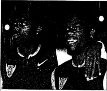
Los gemelos idénticos Alvin (izquierda) y Calvin (derecha) Harrison, de 26 años de edad, celebran su primer y segundo lugar en la carrera de 400 metros en Brisbane, Australia, el 8 de agosto de 2000. Los psicólogos estudian a los gemelos para determinar si algunos aspectos de la personalidad son influidos por la genética.

mino, los enfoques biológicos comúnmente se refieren a tres áreas de investigación dentro de este dominio general: genética, psicofisiología y evolución.