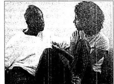
Las diferencias de grupo, como las diferencias entre hombres y mujeres, con frecuencia son estudiadas por los psicólogos de la personalidad.

La personalidad también puede observarse estudiando las diferencias entre grupos. Es decir, las personas en un grupo pueden tener ciertas características de personalidad en común, y estas características comunes hacen a ese grupo de personas diferente de otros grupos. Ejemplos de grupos estudiados por los psicólogos de la personalidad incluyen culturas diferentes, grupos de edad diferentes, partidos políticos diferentes y grupos con diferentes antecedentes socioeconómicos. Otro conjunto importante de diferencias estudiadas por los psicólogos de la personalidad se refiere a aquellas entre los hombres y las mujeres. Aunque muchos rasgos y mecanismos de los humanos son comunes para ambos sexos, unos cuantos son diferentes para los hombres y las mujeres. Por ejemplo, se ha acumulado evidencia de que, a través de las culturas, es más común que los hombres exhiban más agresión física que las mujeres. Los hombres son responsables de la mayor parte de la violencia en la sociedad. Una meta de la psicología de la personalidad es entender por qué ciertos aspectos de la perso-