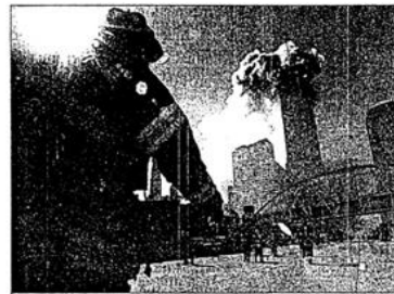
El valor es un ejemplo de un rasgo que sólo se activa bajo circunstancias particulares.

Esto no significa que todos nuestros rasgos y mecanismos psicológicos estén activados en todo momento. De hecho, en cualquier momento en el tiempo, sólo unos cuantos están activados. Considere el rasgo de valentía. Este rasgo es activado sólo bajo condiciones particulares, como cuando las personas enfrentan peligros serios y amenazas a sus vidas. Algunas personas son más valientes que otras, pero nunca sabremos cuáles personas son valientes a menos y hasta que se les presente la situación correcta. Observe a su alrededor la próxima vez que esté en clase; ¿quién piensa que tiene el rasgo de valentía? No lo sabrá hasta que estén en una situación que active el comportamiento valiente.