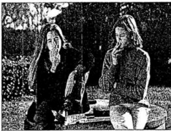
La personalidad se relaciona con la salud al influir en comportamientos relacionados con ésta, como fumar.

Además de la salud, muchos de los problemas importantes en el afrontamiento y la adaptación pueden rastrearse hasta la personalidad. En este dominio, ciertas características de la personalidad se relacionan con una mala adaptación que se han designado como trastornos de personalidad. El capítulo 19 está dedicado a los trastornos de personalidad, como el trastorno de personalidad narcisista, el trastorno de personalidad antisocial y el trastorno de personalidad evitativa. Puede profundizarse una comprensión del funcionamiento "normal" de la personalidad al examinar los trastornos de personalidad, del mismo modo que en el campo de la medicina,